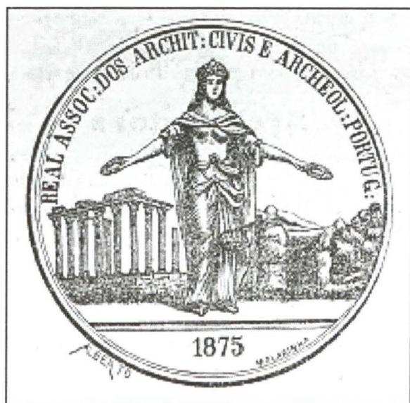
1. Medalha de honra da RAACAP. 1875. AH/AAP