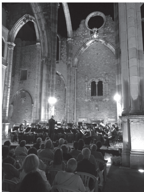
Figura 1 – Concerto integrado no Lisbon Music Fest.

Esta aquisição patrimonial só foi possível graças a uma prudente gestão financeira, praticada pela Direcção ao longo dos últimos 20 anos, e ao crescente número de visitantes, sobretudo nos últimos cinco anos. Com efeito, embora o ano civil ainda não tenha terminado, já foram ultrapassados os objectivos que nos propúnhamos atingir, com um aumento de visitantes de cerca de 16% (atingindo um total de cerca de 282.000) e um aumento muito significativo de actividades culturais, envolvendo prestigiadas instituições e centenas de músicos, actores e pintores, às quais assistiram milhares de pessoas (não contabilizadas como visitantes do Museu), incluindo mais de 20 concertos, integrados no Lisbon Music Fest , além dos Concertos da Primavera e do Outono, da Orquestra da GNR, 20 representações de “O Rei UBU” de Alfred Jarry, pelo Teatro do Bairro, e ainda cinco sessões de cinema, em colaboração com a Filmin. (Figuras 1 e 2)