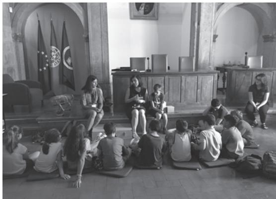
Figura 10 – Actividade do Serviço Educativo do MAC.

Em relação ao Museu e ao próprio edifício, foram realizadas várias acções de conservação e restauro, consideradas mais urgentes, entre as quais se destacam as intervenções feitas em toda a parede norte da nave, incluindo o clerestório, numa extensão de 40m, bem como todas as peças inseridas na mesma. Procedeu-se ainda a uma intervenção de conservação e restauro do túmulo gótico do rei D. Fernando I, em mais uma tentativa de por cobro ao processo de degradação da pedra utilizada na sua feitura, que tem vindo a ser acompanhado por especialistas da DGPC, sendo os resultados até agora obtidos bastante animadores (Figuras 11 e 12).