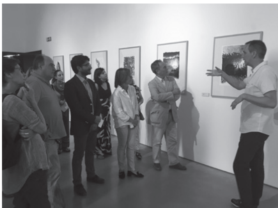
Figura 3 – Exposição no Museu do Côa – “Novos Olhares sobre o Côa – Exposição de Gravura Contemporânea”.

Além da habitual exposição de Artes Plásticas, de alunos e professores da Faculdade de Belas Artes de Lisboa que tem sido realizada no MAC nos últimos 10 anos, durante a primavera, em 2017, na sequência de uma breve “residência artística” que teve lugar no Parque Arqueológico e no Museu do Côa em 2016, foi realizada a exposição “Novos Olhares sobre o Côa – Exposição de Gravura Contemporânea”, que esteve patente ao público no MAC, em Junho e Julho, e no Museu do Côa, de Julho a Setembro, tendo tido um excelente acolhimento por parte do público. Esta exposição, que contou com a participação de 20 artistas, que se inspiraram nas gravuras pré-histórica para criar as suas obras numa linguagem plástica contemporânea, insere-se na campanha desenvolvida pela AAP no sentido de promover a divulgação da Arte do Côa entre o público português e os inúmeros visitantes estrangeiros do MAC. (Figura 3)