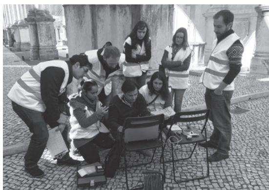
Figura 13 – Trabalhos de diagnóstico de aspectos estruturais do edifício histórico do Carmo.