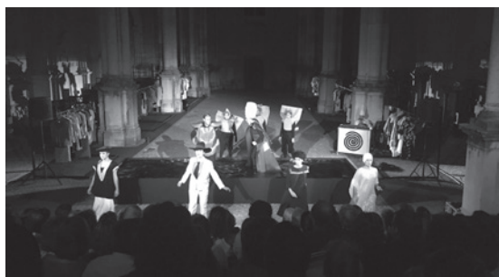
Figura 2 – Peça de teatro no Museu Arqueológico do Carmo.