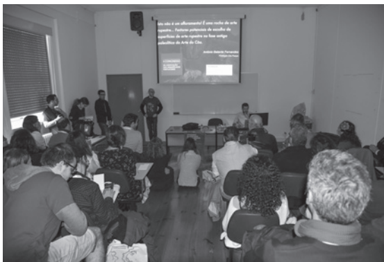
Figura 8 – Aspecto de uma das sessões temáticas do II Congresso da Associação dos Arqueólogos Portugueses.