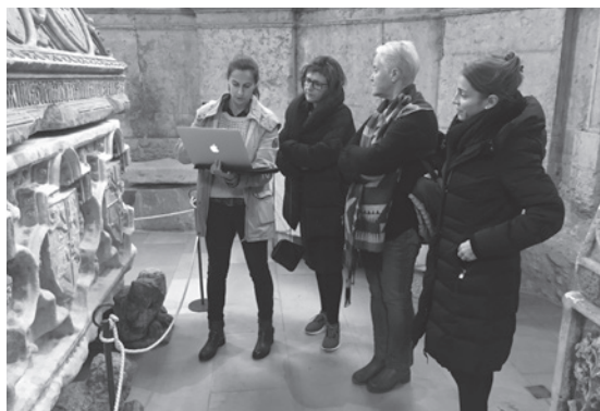
Figura 12 – Trabalhos de conservação e restauro.