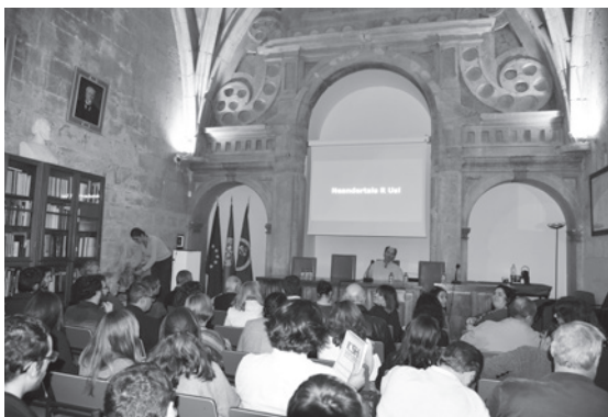
Figura 7 – Sessão inaugural do II Congresso da Associação dos Arqueólogos Portugueses.

Porém, uma das mais importantes actividades desenvolvidas em 2017 foi a realização do II Congresso da AAP, de 21 a 25 de Novembro, com a colaboração da Faculdade de Letras e da Faculdade de Ciências Sociais e Humanas de Lisboa, o qual contou com a participação de cerca de 400 arqueólogos e estudantes de arqueologia de todo o país, que apresentaram um total de 153 comunicações e posters (Figuras 7 e 8). Tal como em 2013, procedeu-se à pré-publicação de todos os trabalhos entregues, num total de cerca de 2100 páginas, entregues aos participantes num inovador cartão USB, anexo ao Livro do Congresso, com o programa e os resumos de todas e posters as comunicações (Figura 9). Este congresso, que correu da melhor forma, graças ao empenho da sua Comissão Organizadora, coordenada de forma muito eficiente pela nossa estima consócia Doutora Andrea Martins.