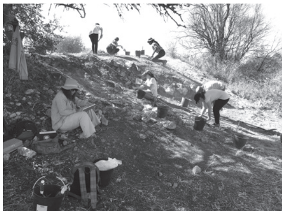
Figura 5 – Trabalhos arqueológicos em Vila Nova de São Pedro.