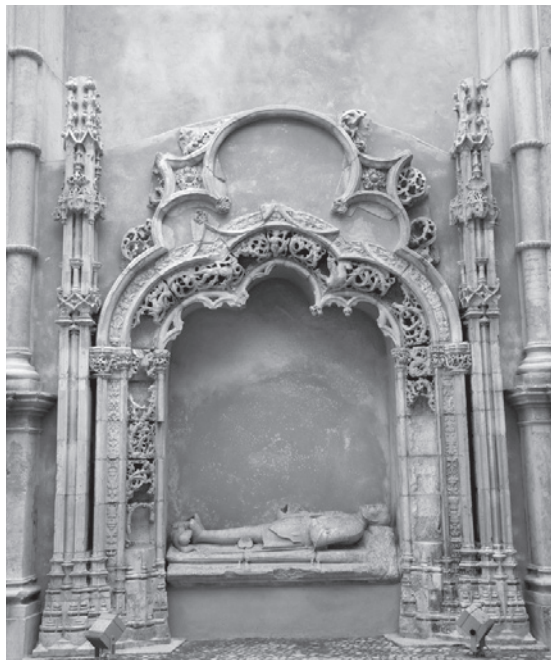
Figura 11 – Trabalhos de conservação e restauro.

No domínio editorial, além do catálogo da exposição Novos Olhares sobre o Côa (Figura 14) e do Livro do II Congresso da AAP, Arqueologia em Portugal 2017 – Estado da Questão , foi publicado mais um volume duplo da revista Arqueologia e História ,