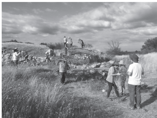
Figura 4 – Trabalhos arqueológicos em Vila Nova de São Pedro.

encontrava, até este ano, no mais completo estado de abandono. (Figuras 4, 5 e 6)