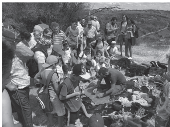
Figura 6 – Dia Aberto em Vila Nova de São Pedro – atelier de arqueologia experimental.