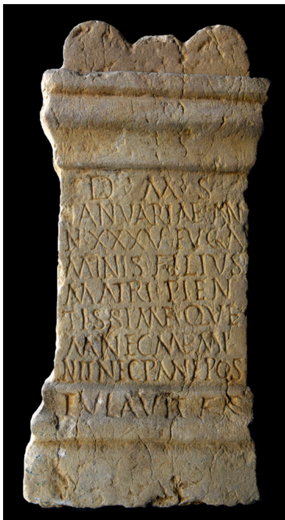
Figura 3 – Ara funerária romana de Entrecampos.

em Conimbriga se chamava P. Aelius Ianuarius (Fabre, 1963). Quanto a Eugamen , nome de etimologia claramente grega, é a primeira vez que se regista na epigrafia romana.