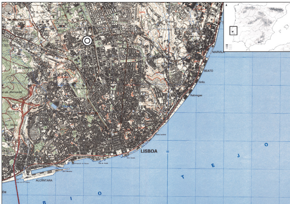
Figura 1 – Localização aproximada do local onde a ara foi identificada. (Base Cartográfica: C.M.P. 1:25 000; Folha 431 – adaptado; Mapa da Península Ibérica de Trabajos de Prehistoria – adaptado).

Desconhece-se se a identificação da ara resultou de trabalhos de escavação da empreitada ou se integra-