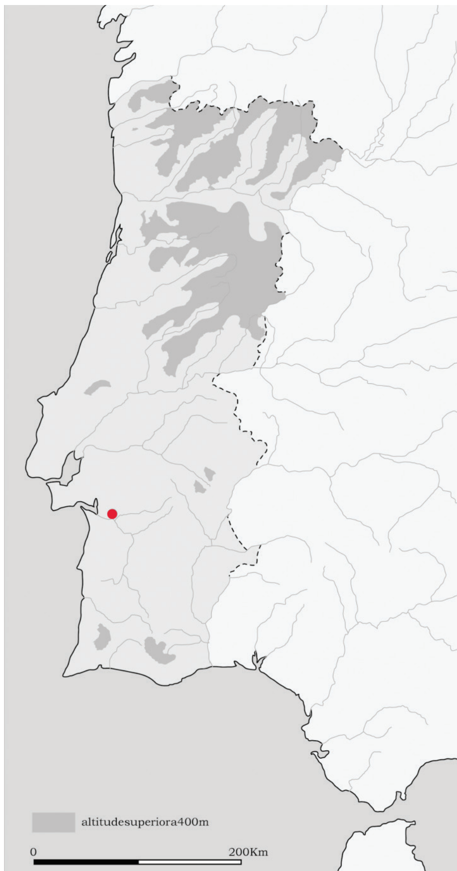
Figura 1 – Localização da necrópole do Olival do Senhor dos Mártires (base cartográfica: Victor S. Gonçalves).