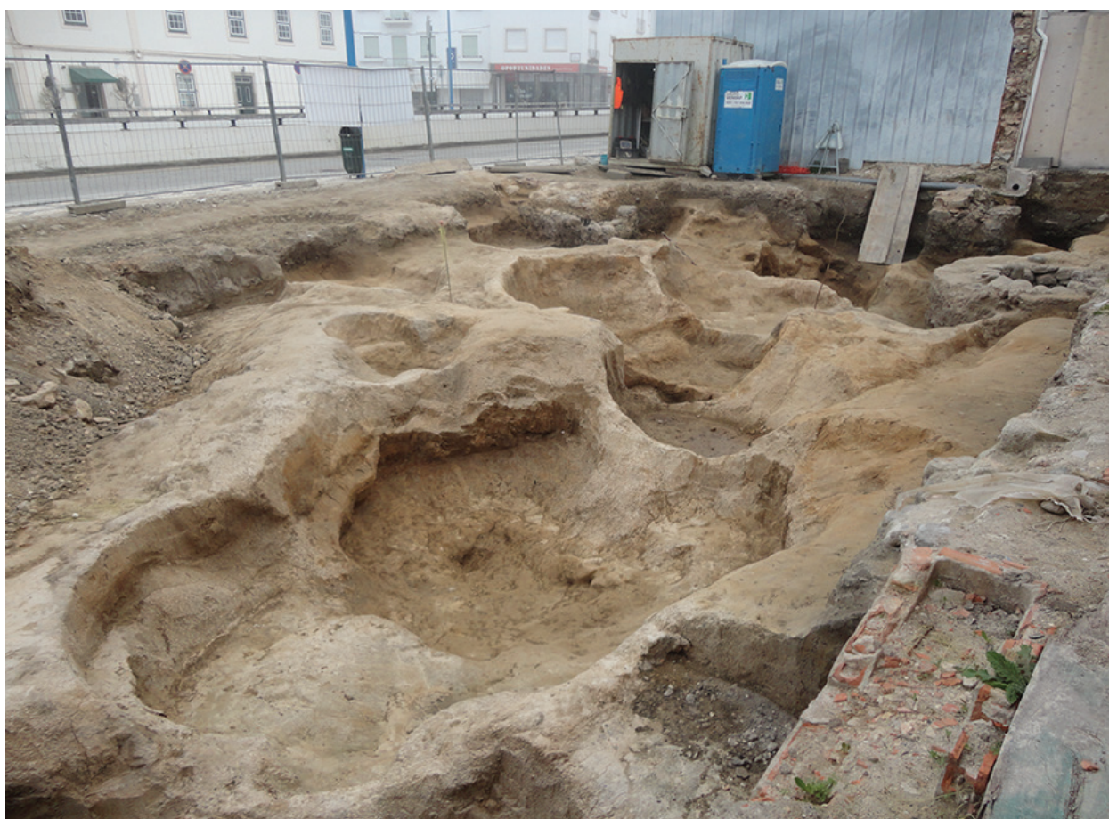
Figura 1 – Vista geral da área da escavação: plano final.

VIQUEIRA, José M. (1957) – Coimbra: impressões y notas de un itinerário , Coimbra Editora Limitada, Coimbra.