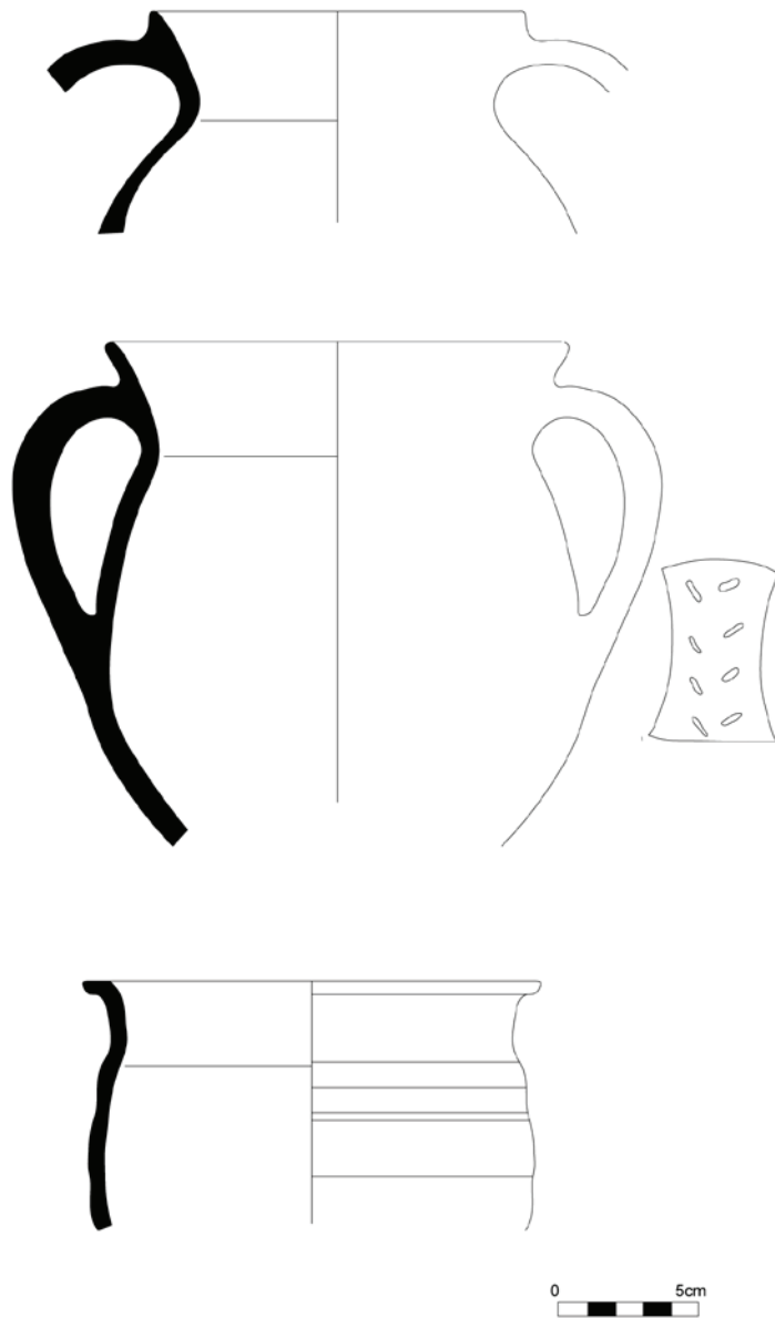
Estampa 2 – Panelas.