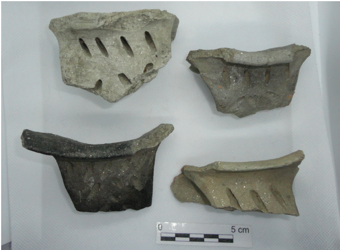
Figura 4 – Asas de bilhas com decoração.