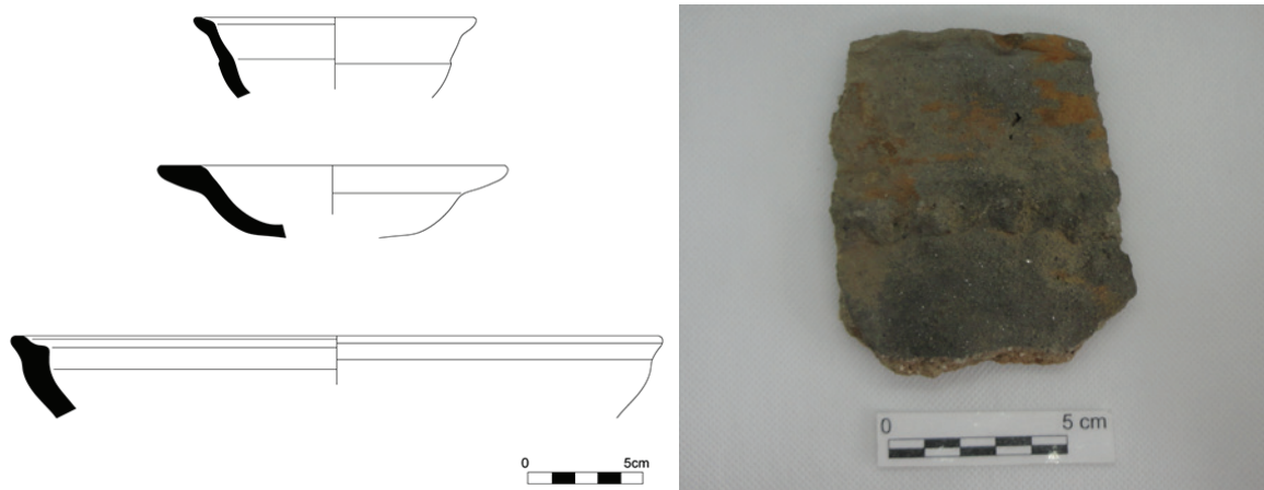
Estampa 3 – Taças. A fotografia é de um alguidar.