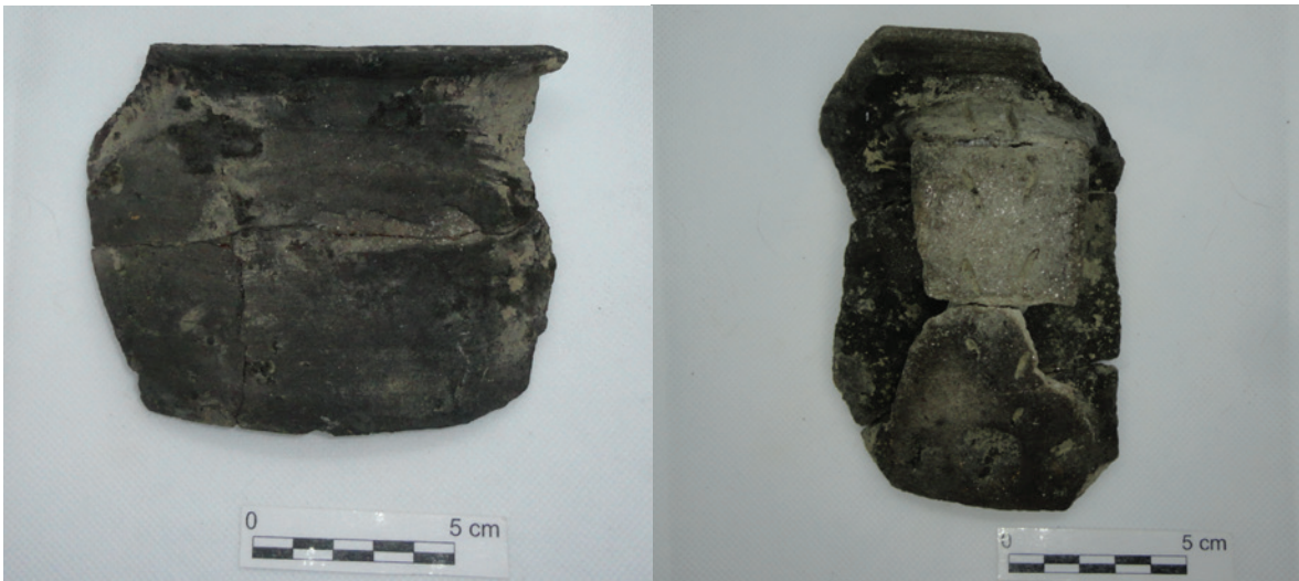
Figura 5 – Painéis.