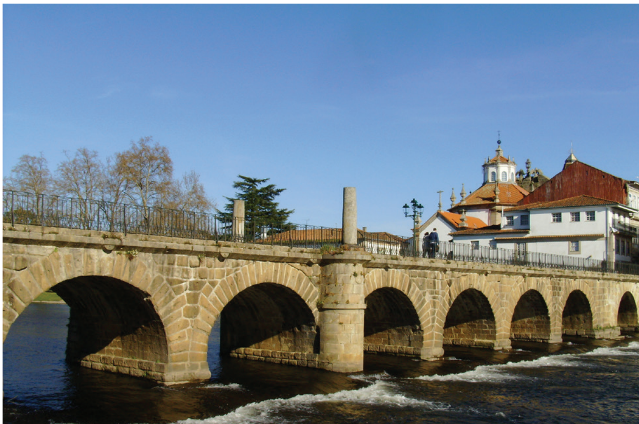
Figura 4 – Ponte de Trajano, Chaves.