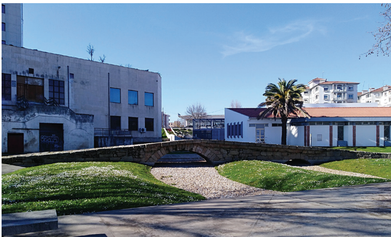
Figura 5 – Ponte das Caldas, Chaves.