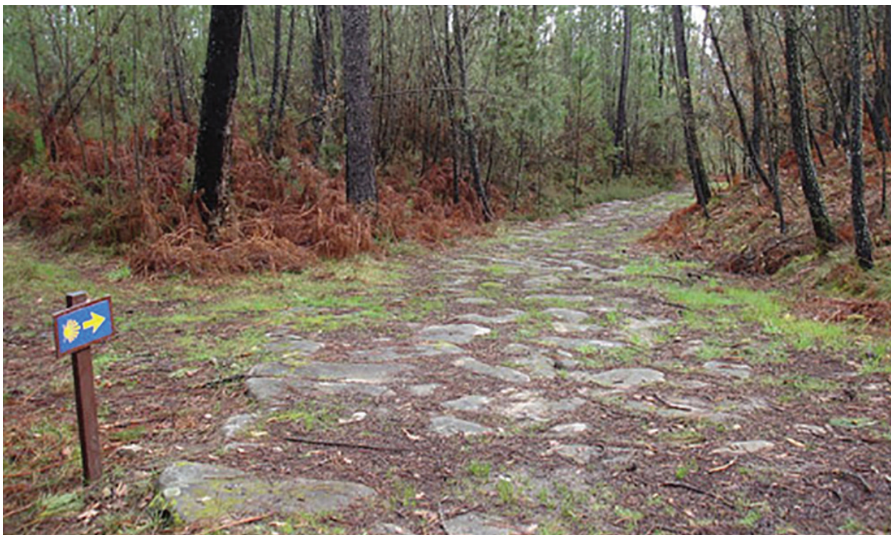
Figura 3 – calçada romana de Pousa Maria em Almargem, Viseu.