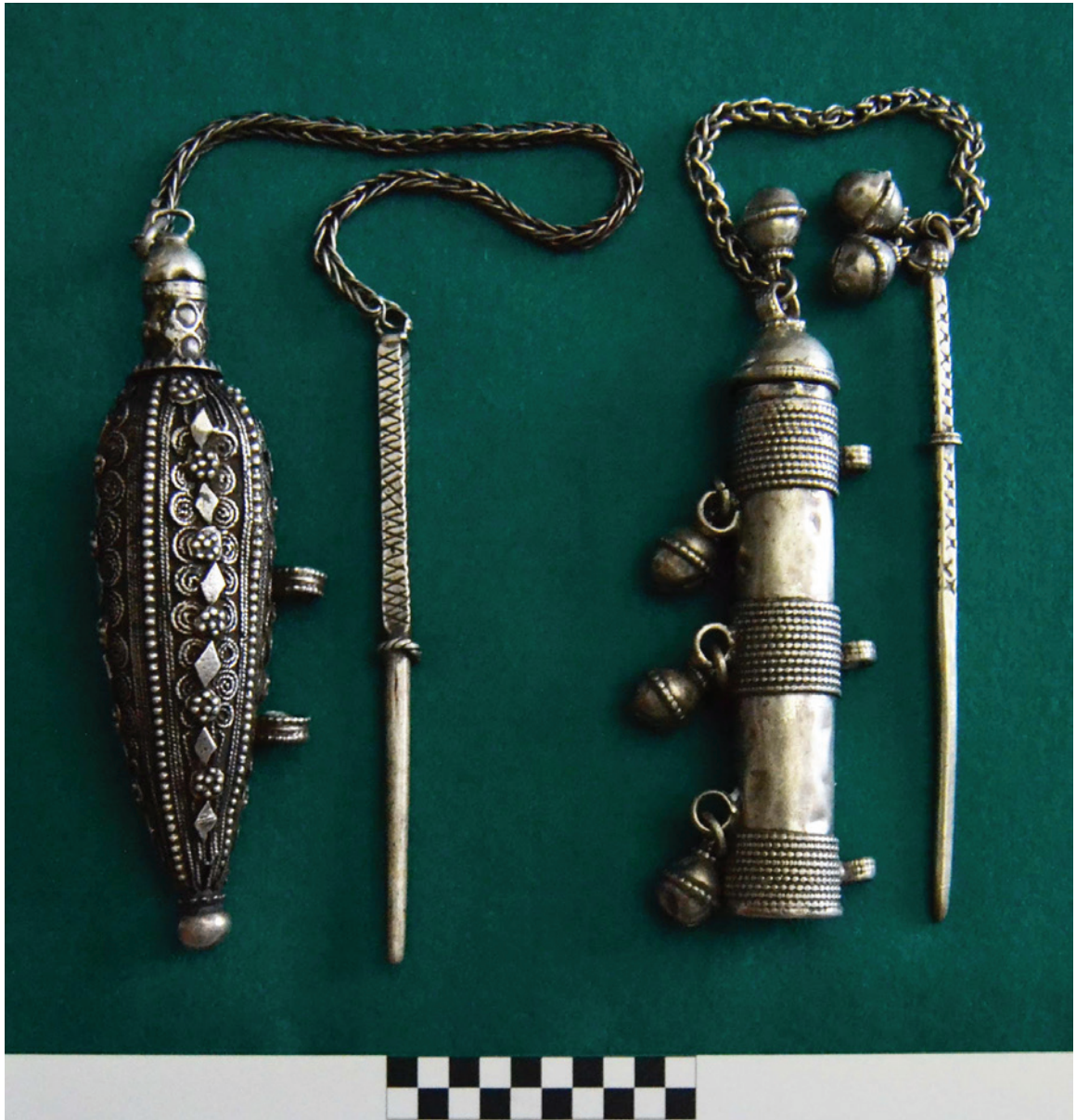
Figura 4 – Recipientes iemenitas para kohl e respectivos aplicadores, de prata, do século XIX (col. R. e M. Varela Gomes).