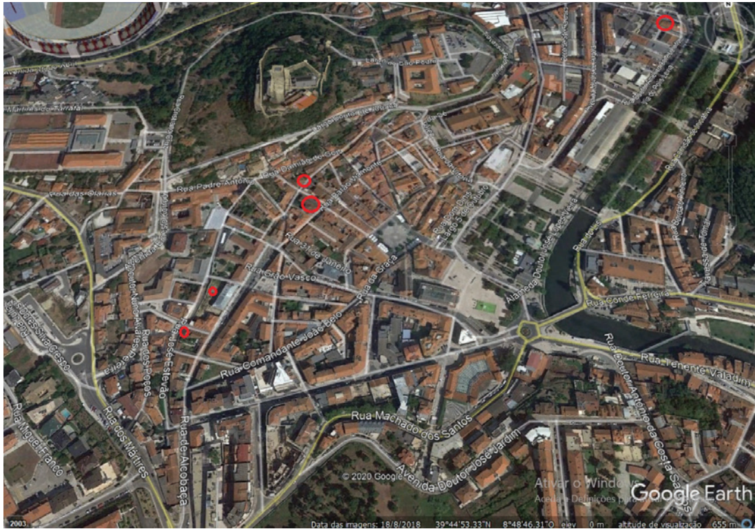
Figura 2 – Localização dos locais intervencionados.