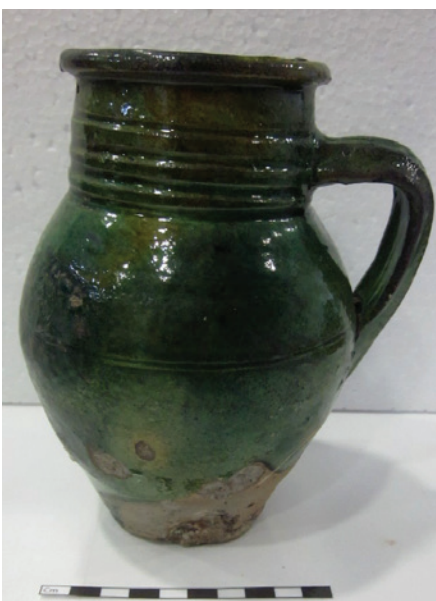
Figura 10 – Canjirão, vidrado plum-bífero verde, XVI-XVII, UE 409.