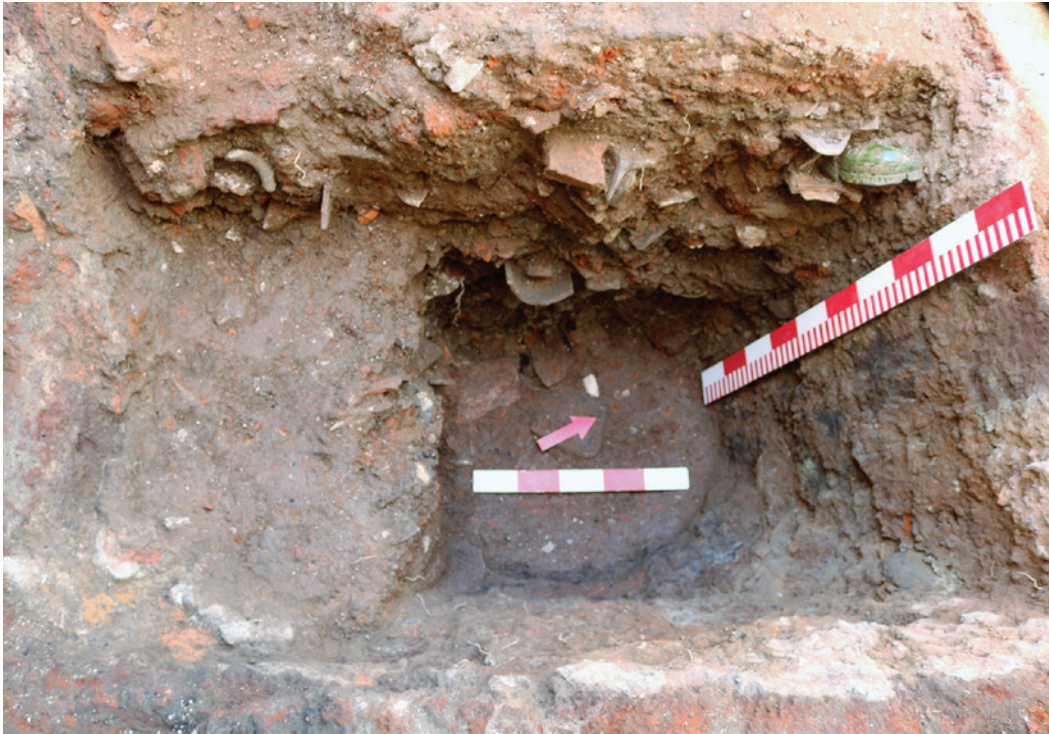
Figura 4 – Interior da estrutura depois de decapar parte do interior.