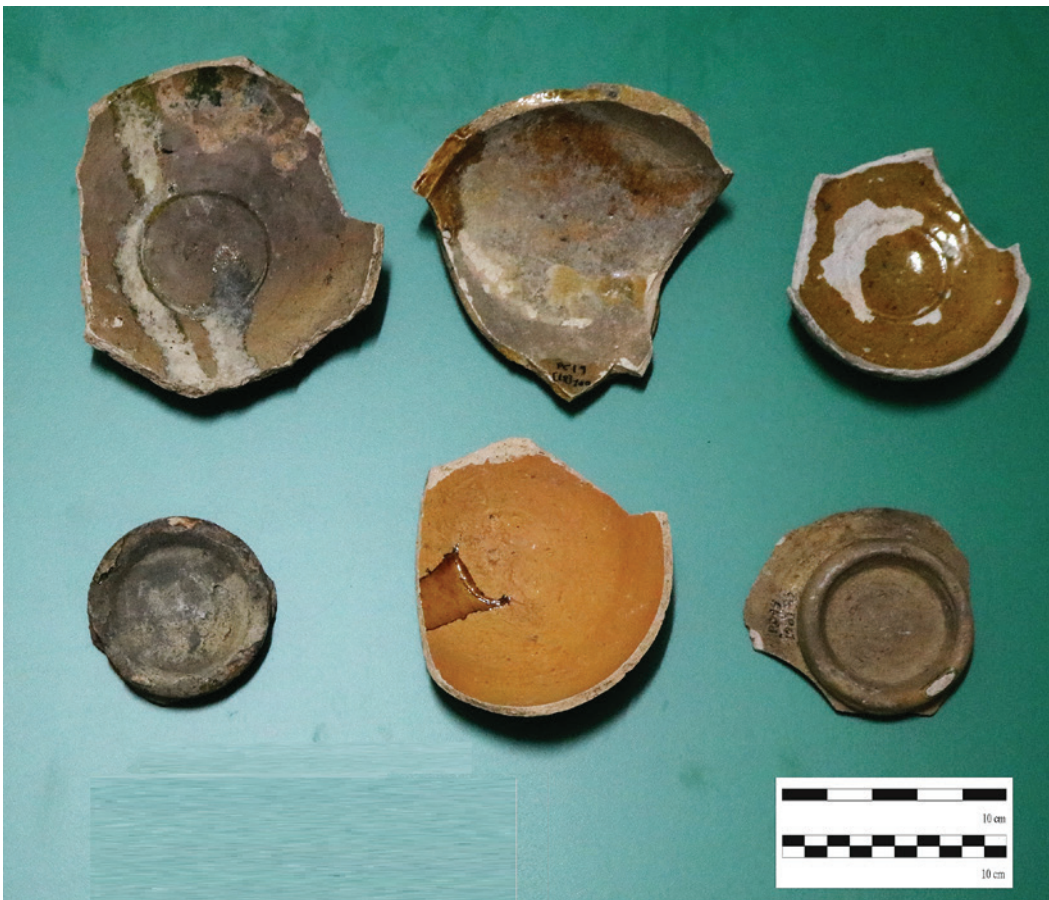
Figura 5 – Fragmentos recuperados – séc. XVIII.