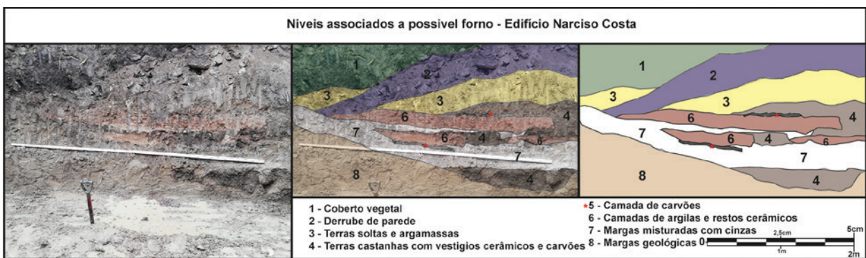
Figura 9 – Níveis associados a estrutura de combustão.