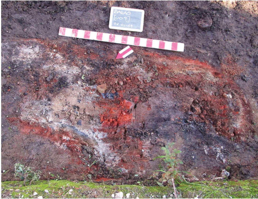
Figura 6 – Estrutura de pequena dimensão –aquela menos destruída.