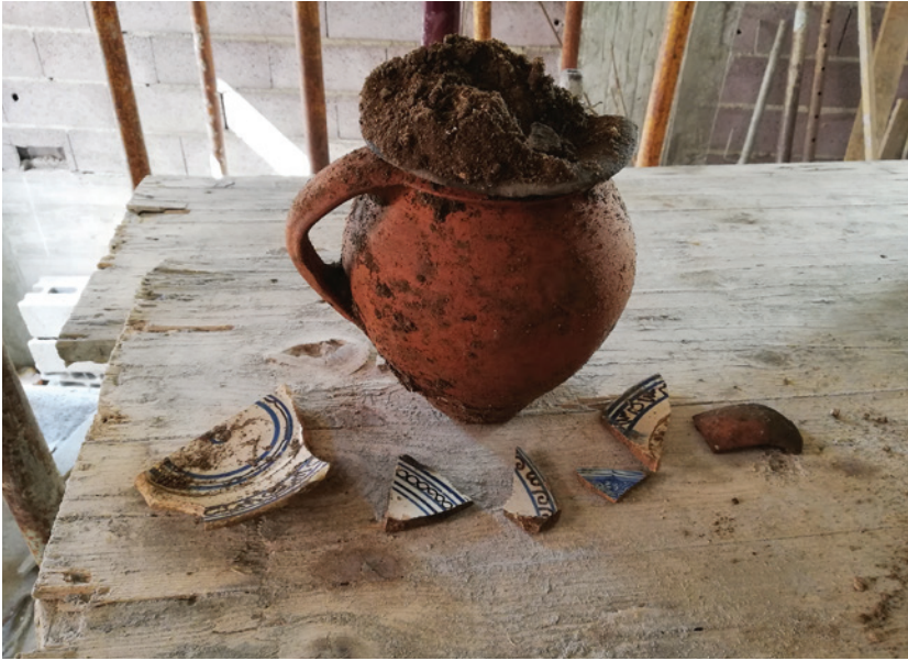
Figura 8 – Fragmentos em faiença e perfil completo, em cerâmica fosca.