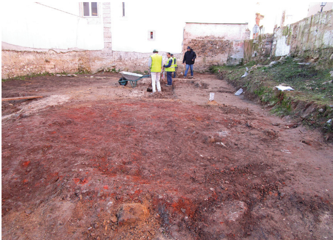
Figura 7 – Imagem a partir de norte para sul, antes da escavação de cobertura.