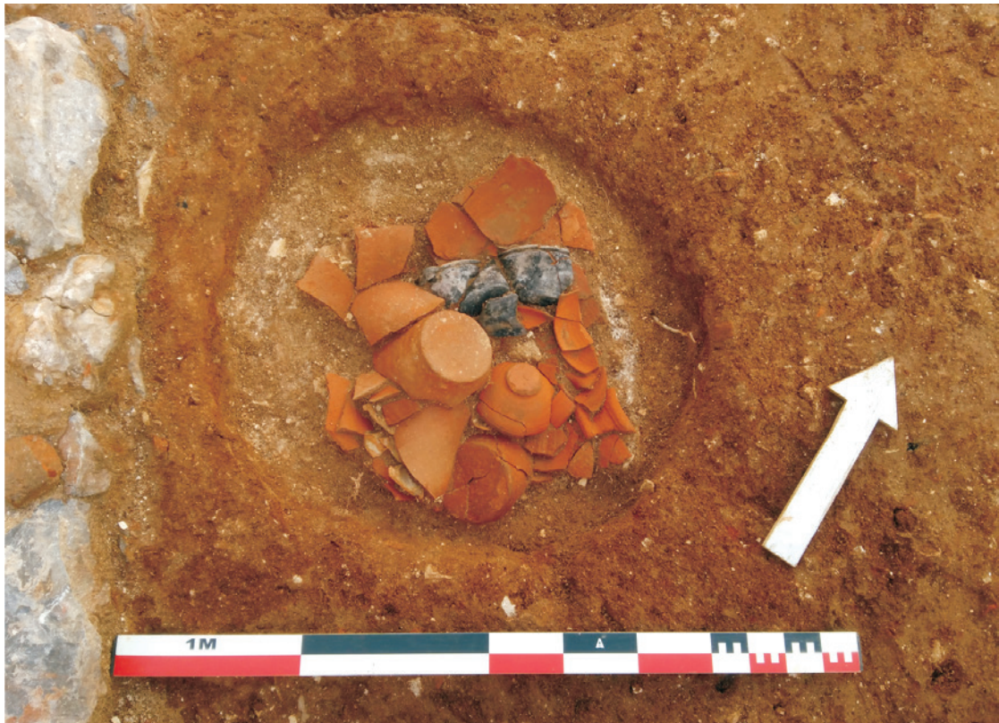
Figura 5 – Pormenor da fossa detritica identificada no compartimento 4.