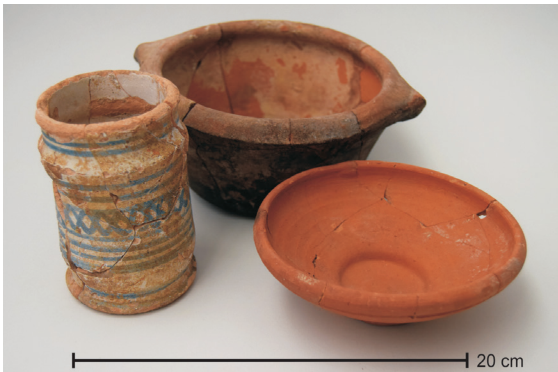
Figura 9 – Materiais exumados na fossa do compartimento 4 (Autor: José Pedro Henriques).