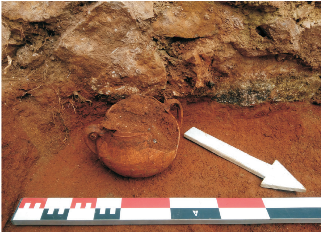
Figura 8 – Pormenor da panela in situ exumada no compartimento 4.