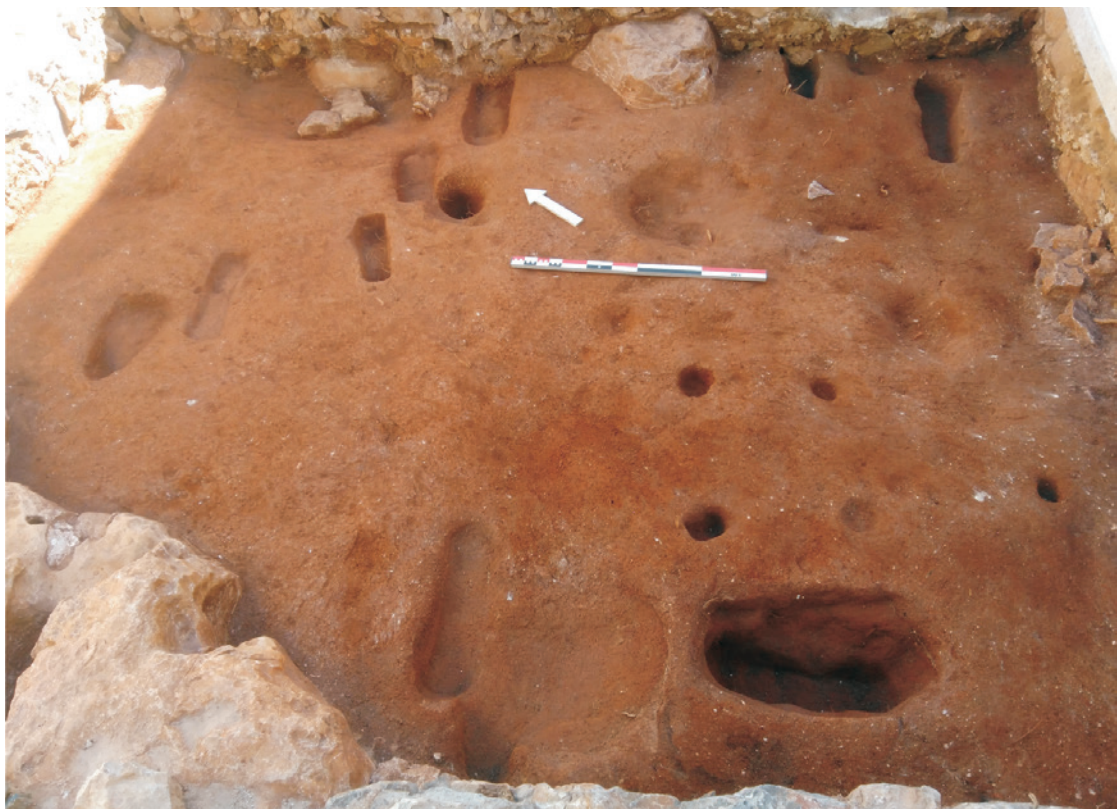
Figura 6 – Vista geral das estruturas negativas para pés de vinha do compartimento 4.