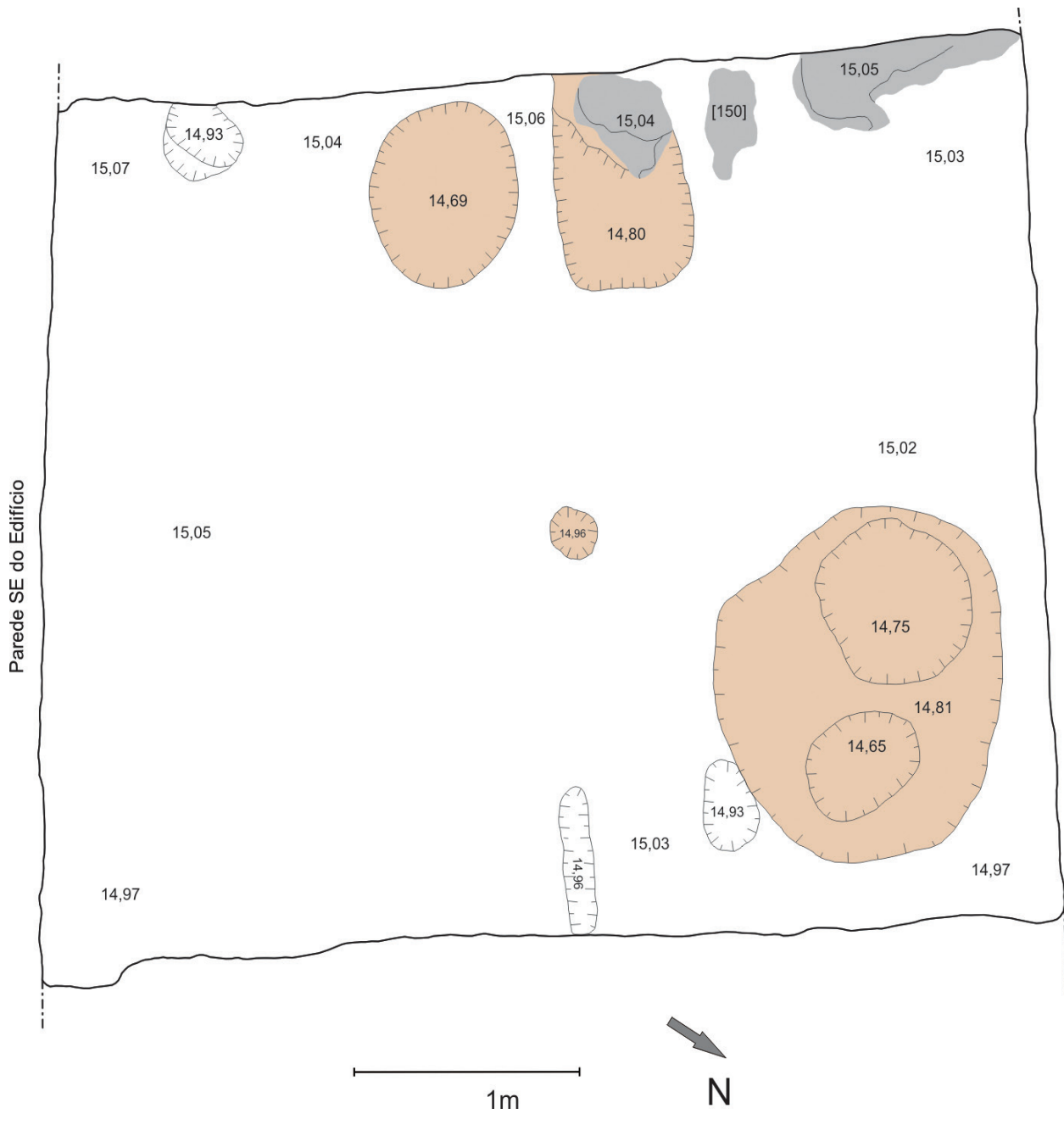
Figura 4 – Nível de fossas detriticas do compartimento 4 (a castanho claro).