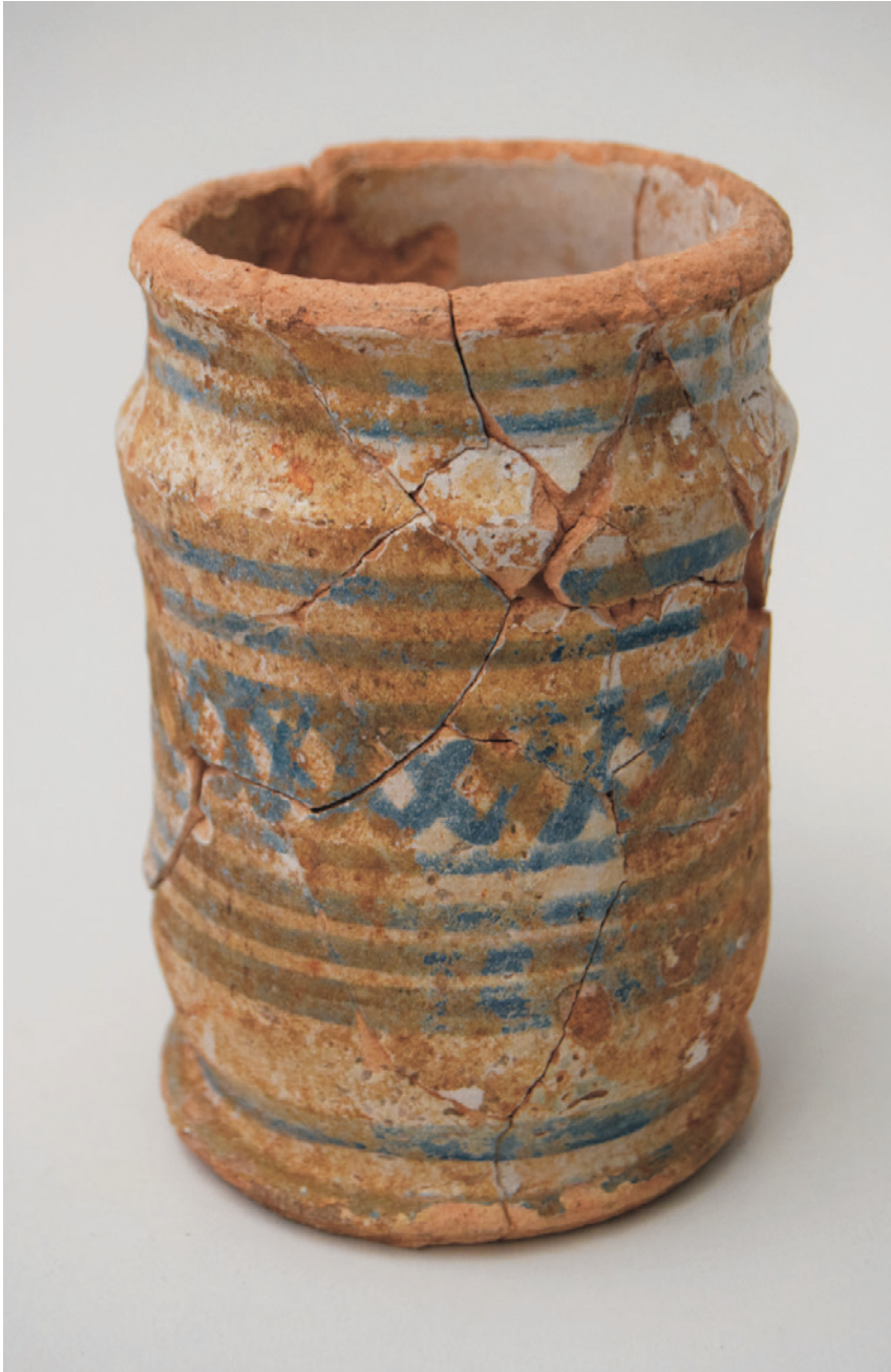
Figura 10 – Albarello de produção inglesa da segunda metade do século XVII (Autor: José Pedro Henriques).